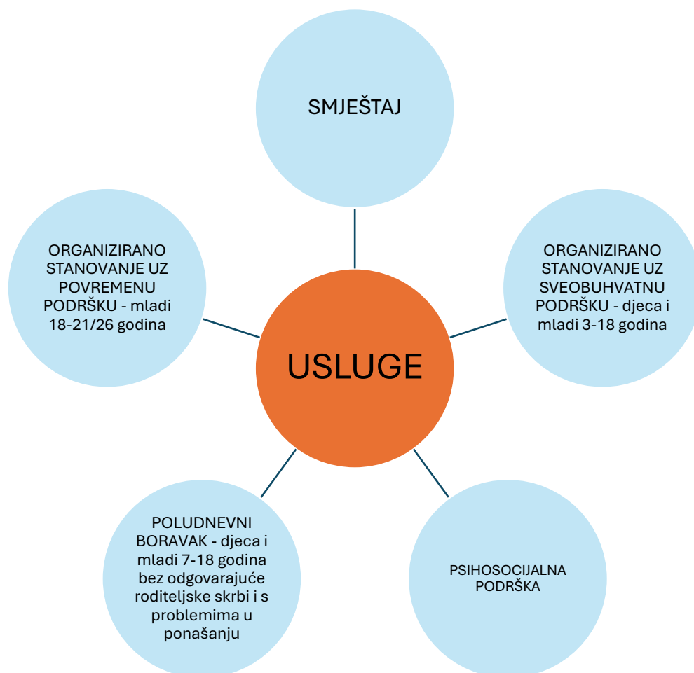
Grafički prikaz br. 1 – Socijalne usluge koje pružamo prema važećem Statutu Centra za pružanje usluga u zajednici Svitanje

Godišnje programe po vrstama socijalnih usluga donosi ravnatelj, a koji po donošenju postaju sastavni dio ovog Plana i programa rada.